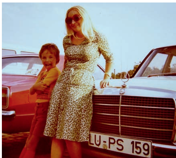
Das Foto zeigt leider nur wenig vom ersten schönen Mercedes. Wir haben nie viel fotografiert und dieses Bild sollte eine Erinnerung für unseren Patensohn sein, mit dem wir im Sommer 1975 die Bundesgartenschau in Mannheim besuchten.

Mercedes bleiben wir immer noch treu und er uns auch, wenn wir als Ruheständler damit auch meist nur kurze Strecken über unsere schönen Dörfer an der Weinstraße fahren.